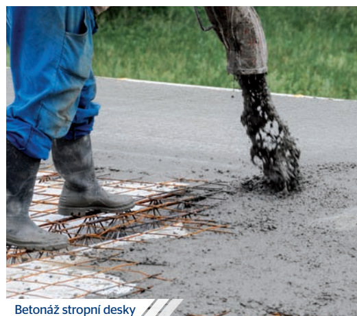
Betonáž stropní desky