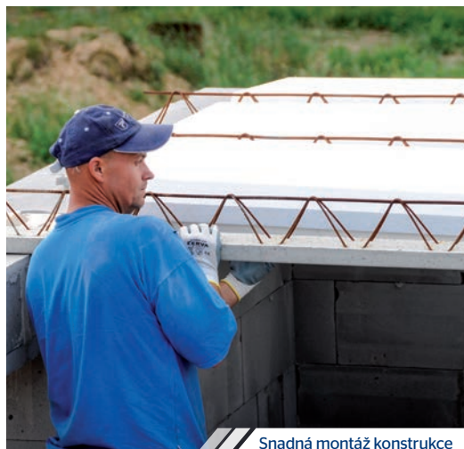
Snadná montáž konstrukce