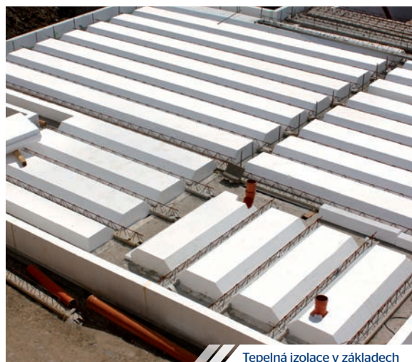
Tepelná izolace v základech