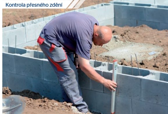
Kontrola přesného zdění

Vysoká rovinnost povrchu základové desky realizované betony CEMEX usnadňuje montáž stěnových konstrukcí i provádění podlah. Chytré navržené systémové řešení pak umožňuje velmi rychlé provedení kompletních základů (100 m 2 již za 6 dnů).