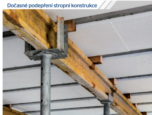
Dočasné podepření stropní konstrukce

Systém stropních desek ELEGOHOUSE přináší řadu dalších výhod, které zjednodušují jak realizaci, tak návazné práce. Například odpadá nutnost problematických dobetonávek, rovný a kompaktní podhled je vhodný pro omítky z jednoho materiálu, přímo ve stropní desce lze vést technické instalace, vysoká rovinatost a přesnost ulehčí provádění navazujících konstrukcí včetně podlah atd. V neposlední řadě disponuje stropní systém ELEGOHOUSE velmi rychlou dobou výstavby (100 m 2 za 2 dny).