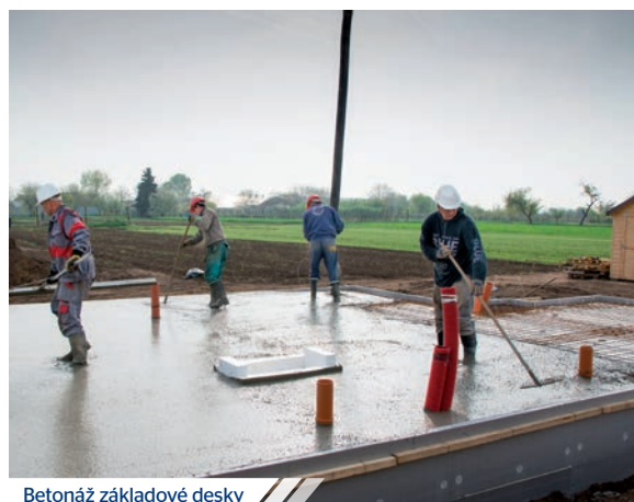
Betonáž základové desky