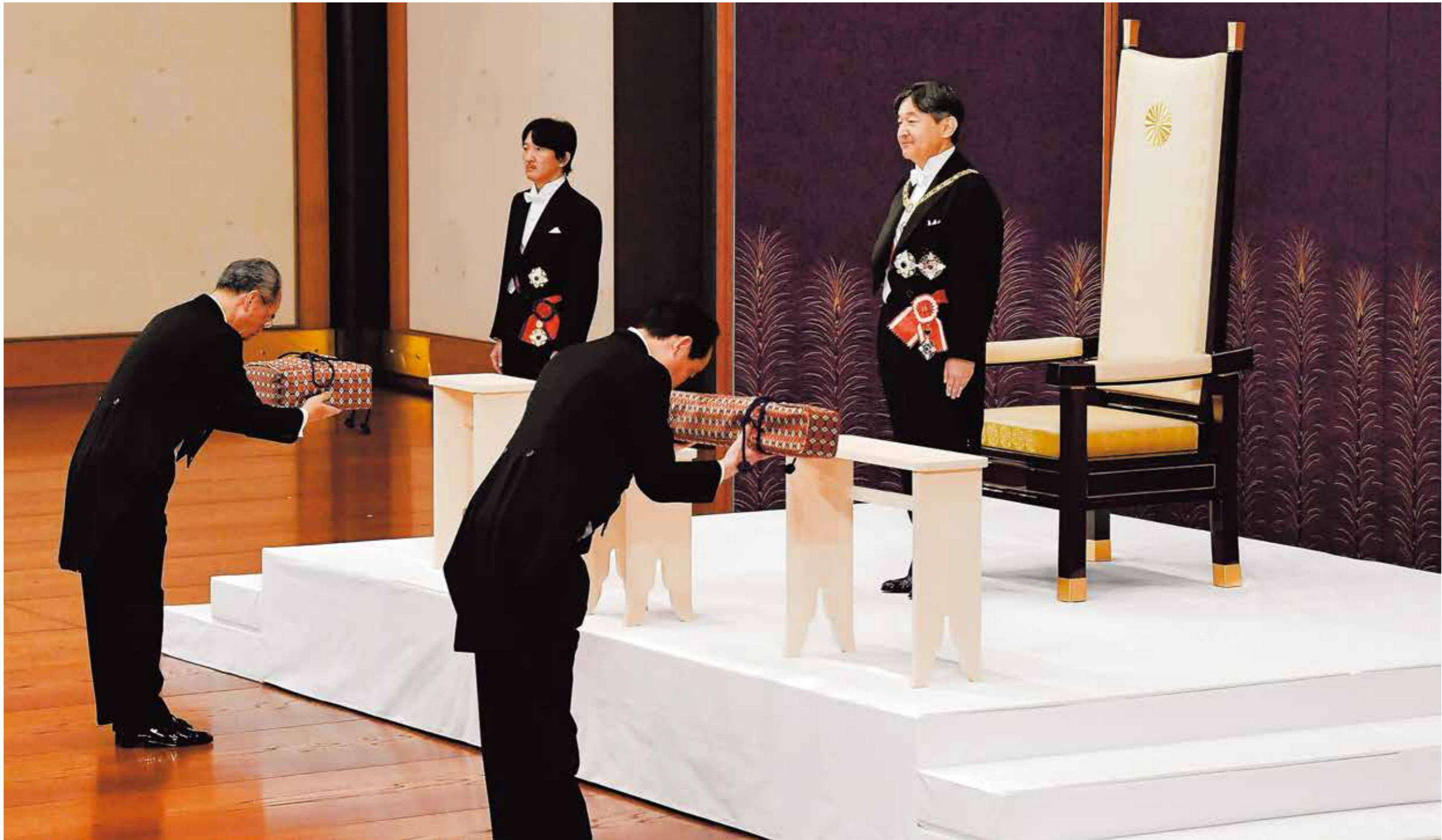
「剣璽等承継の儀」に臨まれる天皇陛下。1日午前10時32分、宮殿・松の間