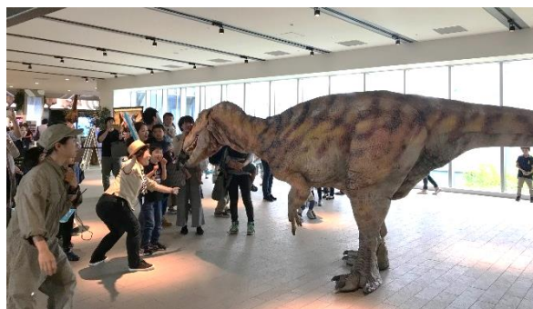
昨年開催時の様子

※館内を練り歩くグリーティング形式です。 ※各回約20分を予定しています。 ※混雑状況などにより開催時間が前後する場合がございます。 最新の情報はオービィ横浜公式ホームページをご確認ください。 ※予約不要