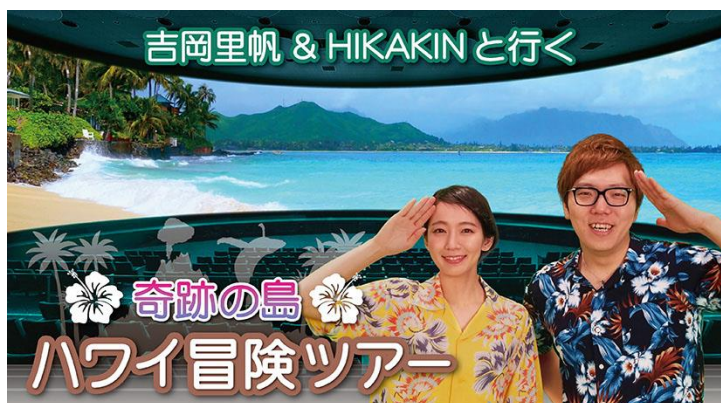
『吉岡里帆 & HIKAKIN と行く「奇跡の島 ハワイ冒険ツアー」』キービジュアル