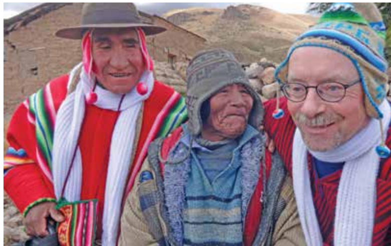
Projektreise 2016: Treffen mit betagten Mitgliedern einer Ayamara-Gemeinschaft auf dem Hochland Boliviens in der Nähe von Oruro