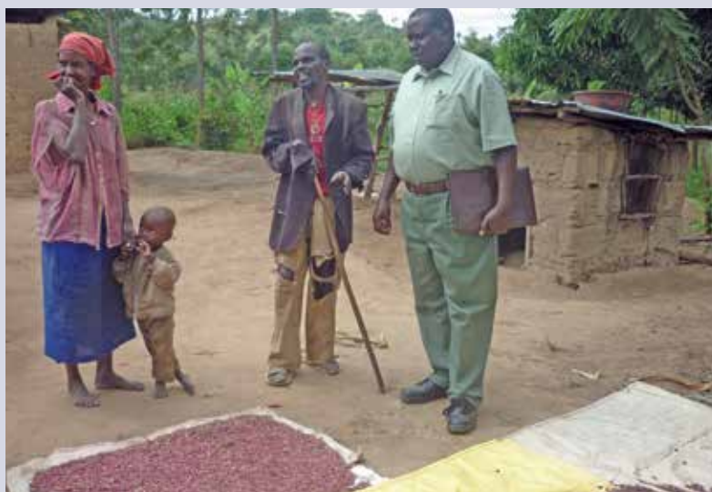
Mit einem eigenen Fahrzeug können Erzeugnisse der Bauerngruppen gewinnbringender auf Märkten verkauft werden.

Die Betroffenen leben in sehr abgelegenen Gebieten Kenias. Nur mit einem Geländefahrzeug können unbefestigte und hügelige Strassen bezwungen werden, um die Familien zu erreichen.