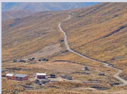
Mit dem Pick-up müssen Bauerngemeinschaften auf über 4 000 Metern über Meer erreicht werden.

«Bolivien», Projekt 190048: Mittelbedarf CHF 27 200.–