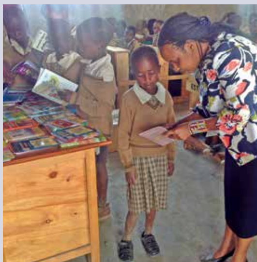
Besonders benachteiligten Kindern wird der Zugang zu Schulen ermöglicht.

COTRR begleitet die Zielbevölkerung, um ungenutztes Potenzial, Ressourcen und Wissen zu entfalten. So erleichtert beispielsweise eine Schafzucht Massai-Gemeinschaften das Leben, da sie Milch und Fleisch verkaufen können. Gleichzeitig können mit Regenwassertanks Dürreperioden besser überwunden werden. Mit Sensibilisierungskampagnen werden verschiedene Themen diskutiert und Lösungen zu aktuellen Problemen gesucht.