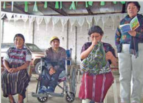
«Guatemala», Projekt 190044: Mittelbedarf CHF 19 700.–

Ein Pick-up ermöglicht regelmässige Besuche aller Gruppen. Verteilt werden Sachspenden und Medikamente. Therapeutinnen gelangen an ihr Zielort und Patienten kommen in geeignete Gesundheitseinrichtungen. Nun hat ihr Fahrzeug das Ende des nützlichen Dienstes erreicht und muss dringend ersetzt werden.