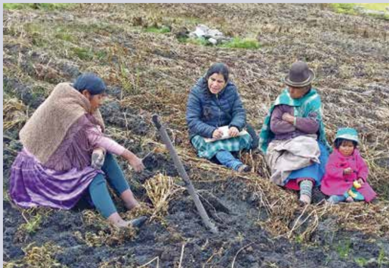
Die landwirtschaftliche Beratung von indigenen Bäuerinnen findet vorzugsweise direkt auf dem Land statt.

Um in den bolivianischen Anden die Ernährung zu sichern, muss der Anbau von einheimischen Kartoffeln oder Mais gefördert werden. Ein robuster Pick-up ist dabei unverzichtbar.