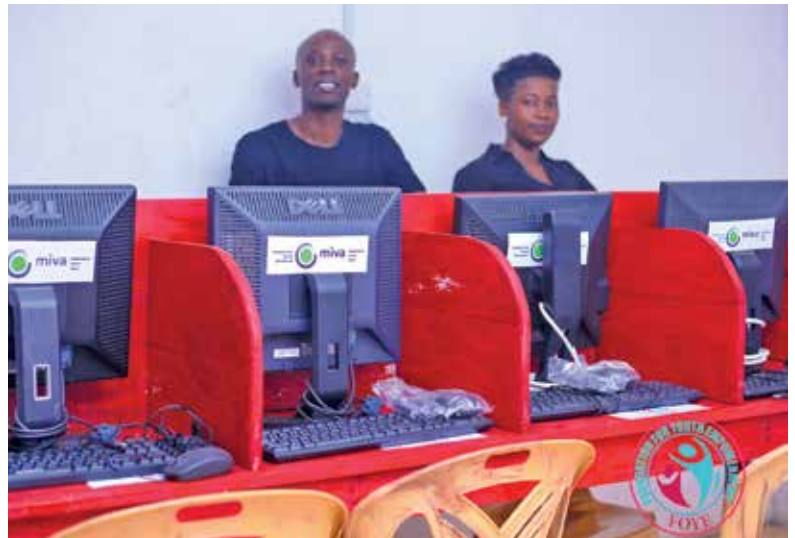
Auf dem Arbeitsmarkt sind Computerkenntnisse gefragte Kompetenzen.

In Uganda sind über 60% der Menschen jünger als 25 Jahre. Viele von ihnen haben grosse Schwierigkeiten, eine Anstellung zu finden. Eine Ausbildung gibt Hoffnung.