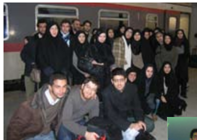
واحد فرهنگی و فوق برنامه امور دانشجویان شاهد و ایثارگر

در آغاز سال تحصیلی ۸۸-۸۷ نیز همانند سالهای گذشته دانشجویان ورودی جدید با حضور در جوار بارگاه ملکوتی حضرت امام رضا (ع) سال تحصیلی جدید را شروع کردند. در این اردوی زیارتی، توجیهی تعداد ۷۳ نفر از دانشجویان در مرحله اول و تعداد ۵۳ نفر در مرحله دوم به بارگاه ملکوتی امار رضا (ع) تشریف یافتند. که در مدت ۲ شب و ۳ روز اقامت در مشهد مقدس به زیارت بارگاه ملکوتی حضرت ثامن الحجج (ع) رفته و از برنامه های معنوی آستان مقدس همچون نمازهای جماعت، سخنرانیها، دعای کمیل، نماز جمعه و... بهره بردند. در نشست صمیمانه ای علاوه بر مدیر کل امور دانشجویان شاهد و ایثارگر، ریاست محترم دانشگاه، معاونت دانشجویی و فرهنگی و چند تن از اساتید مشاور دانشجویان شاهد و ایثارگر حضور داشتند. در این جلسه پس از قرائت قرآن ابتدا مدیر کل امور دانشجویان شاهد و ایثارگر به معرفی ستاد شاهد و تشریح مجموعه فعالیتهای آن پرداختند. سپس ریاست محترم دانشگاه و معاونت دانشجویی و فرهنگی برای دانشجویان صحبت نمودند و پاسخگوی سئوالات دانشجویان بودند و در بخش اصلی این جلسه نیز دانشجویان بر اساس رشته تحصیلی به ۵ گروه تقسیم شده و با اساتید مشاور به بحث و تبادل نظر پیرامون مسائل مختلف آموزشی و رشته درسی خود پرداختند.